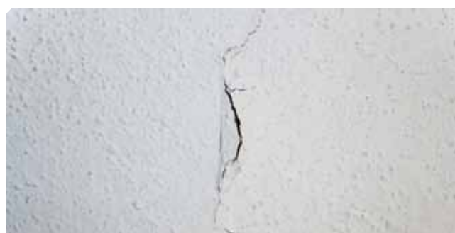
■ Cavità di supporto debole